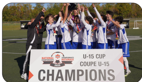
MILTON MAGIC FC (M15)