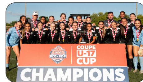
PICKERING FC (F17)