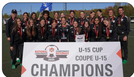
CS OPTIMUM VICTORIAVILLE (F15)