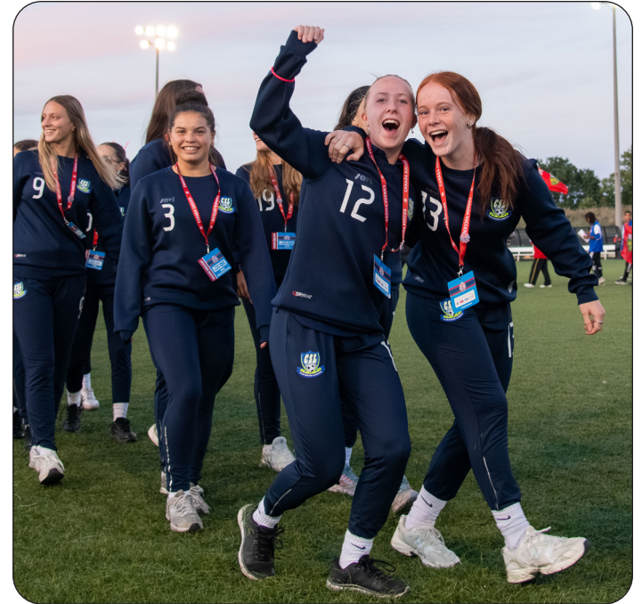
PDP Championship / Championnat PDJ