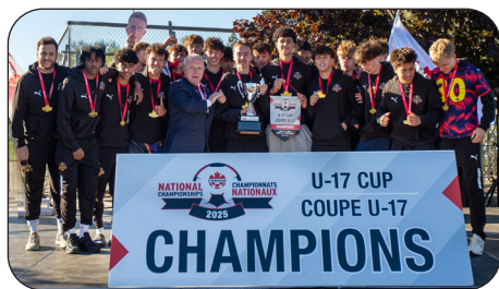
SUBURBAN FC (M17)