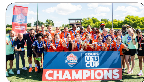
CS SAINT-LAURENT (F15)