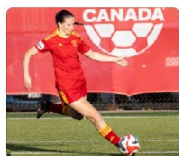
Canada Soccer (Surrey, Ottawa FC)